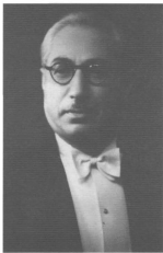
الدكتور محمد حسين هيكل في شبابه رئيس حزب الأحرار الدستوريين فيما بعد